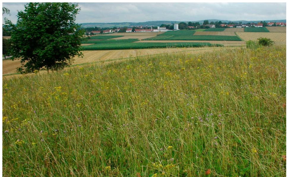
Das Jakobs-Kreuzkraut besiedelt vor allem eher trockene, extensiv gemähte oder beweidete Wiesen mit offenen Bodenstellen. Es ist ein typischer Bestandteil der Wiesenflora (Foto: Andreas Zehm).