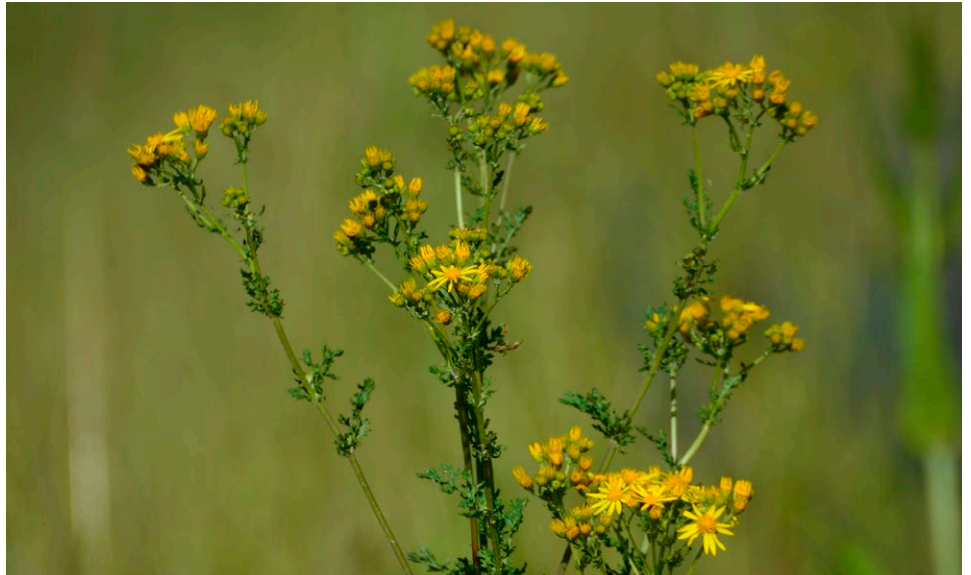
Das 30 bis 120 cm hohe Jakobs-Kreuzkraut ist ein am oberen Sprossende gelb blühender Korbblütler mit zahlreichen Röhrenblüten und randlichen Zungenblüten sowie nach oben am Stängel zunehmend stark zerteilten Blättern.

Das Jakobs-Kreuzkraut kann sehr leicht mit dem Raukenblättrigen Kreuzkraut ( Senecio erucifolius )