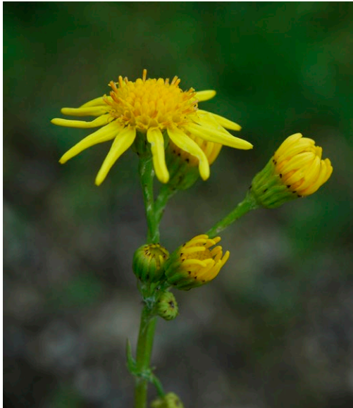
Kreuzkraut-Blüte mit den zentralen Röhrenblüten und umgebenden blattartigen Zungenblüten sowie den grünen, anliegenden Hüllblättern.

an landwirtschaftliche Maschinen, Pflegegeräte, Autos, Züge, Kleidung sowie Fell- und Federkleid an und kann somit leicht verschleppt werden. Die Windausbreitung ist von der Hauptwindrichtung sowie der Windstärke im Zeitraum der Samenreife abhängig, wobei das Ausbreitungsrisiko in Entfernungen über 50 m deutlich sinkt. Im Boden baut das Jakobs-Kreuzkraut ein Samenpotenzial mit bis zu 25 Jahre keimfähigen Samen auf. Aus diesem kann es sich regenerieren, wenn durch Vegetationslücken oder Nutzungsänderungen Licht bis auf den offenen Boden fällt.