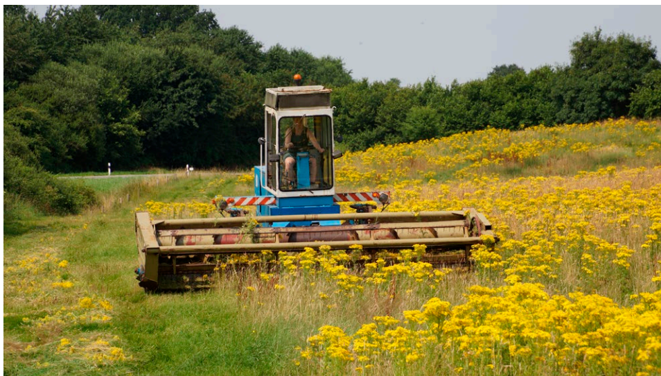
Bei großflächigen individuenreichen Vorkommen kann eine Mahd zur Vollblüte (gegen Mitte Juli) die Jakobs-Kreuzkraut-Anzahl deutlich verringern und die Samenproduktion verhindern. Sowohl Regeneration als auch Nachblüte werden so am wirkungsvollsten minimiert.

auch die Nachblüte. Bei einer Mahd vor der Blüte entwickelt sich über zahlreiche Seitentriebe eine intensive Nachblüte oder die Pflanzen überdauern als Rosette ein weiteres Jahr, um im Folgejahr umso üppiger zu blühen.