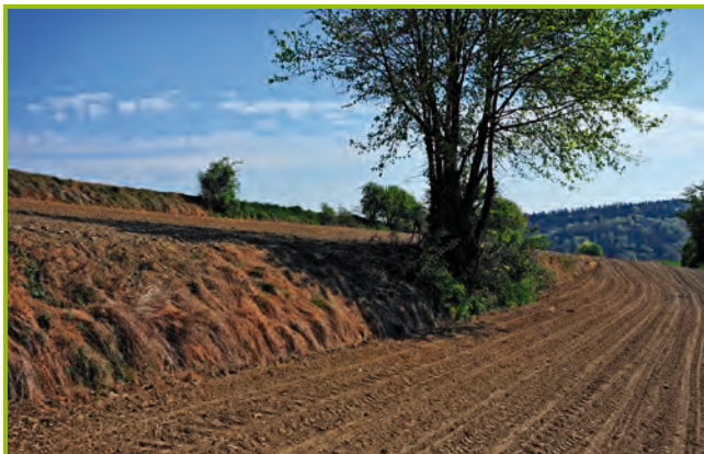
Ackerterrassen bei Schiltberg