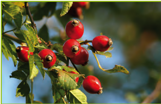
Hagebutten, ©2014 Peter Smola / pixelio.de

Zum Themenkreis KULTURSPUREN Kulturlandschaftselemente im Wittelsbacher Land sind neben einer Landkreiskarte und einem allgemeinen Faltblatt folgende Informationsprospekte erhältlich: