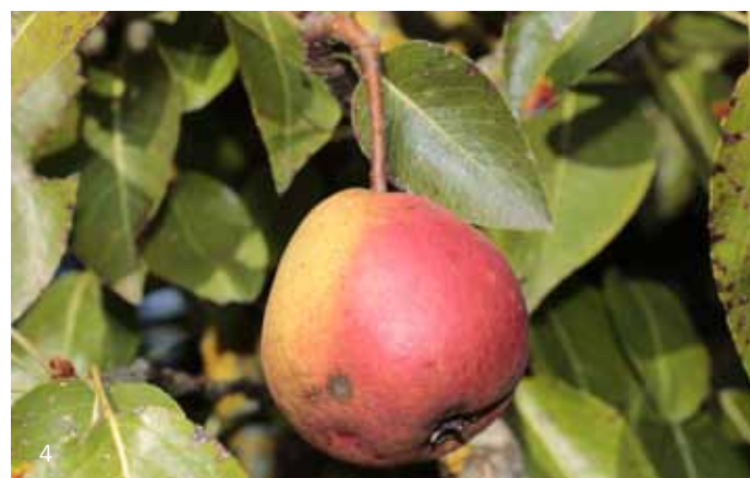
Die häufig vorkommenden regionaltypischen Sorten Kesseltaler Streifling (2), Pfaffenhofer Schmelzling (3) und Ulmer Butterbirne (4)