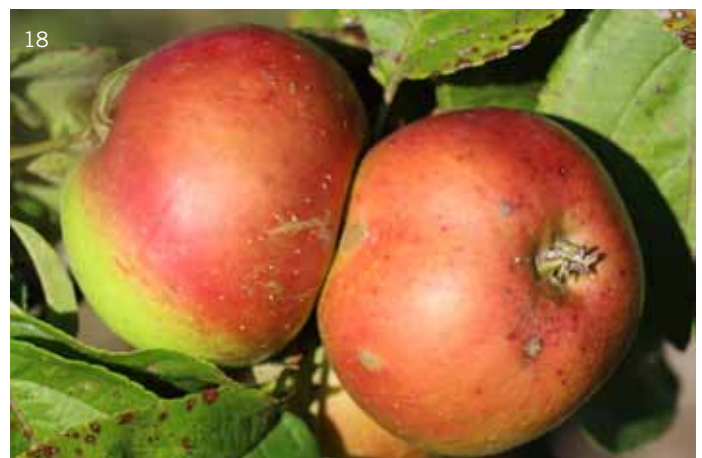
Untereichingen 5219 (Bild 17) ist wegen seines säuerlichen Geschmacks und seiner mürben Konsistenz den Küchenäpfeln zuzuordnen. Eisenburg 2440 dagegen ist ein sogenannter Süßapfel, der nahezu keine Säure schmecken lässt. Von den beiden ertragreichen Sorten wurden zwar mehrere Bäume erfasst, ihre Namen aber sind bis jetzt nicht bekannt.