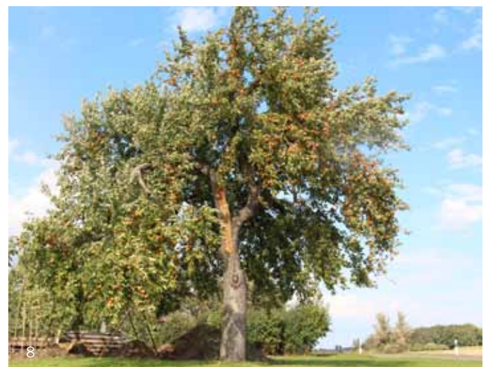
Der Wirtschaftsapfel Pfahlinger (Bild 5) ist eine für Schwaben regionaltypische Sorte, ebenso der Leitheimer Streifling (Bild 6). Der lebhaft gefärbte Doberaner Borsdorfer (Bild 7) dagegen hat seinen Ursprung im Kreis Rostock, die Apfelsorte Keuleman (Bild 8) ist niederländischer Herkunft.