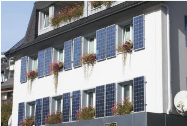
Photovoltaik an der Fassade