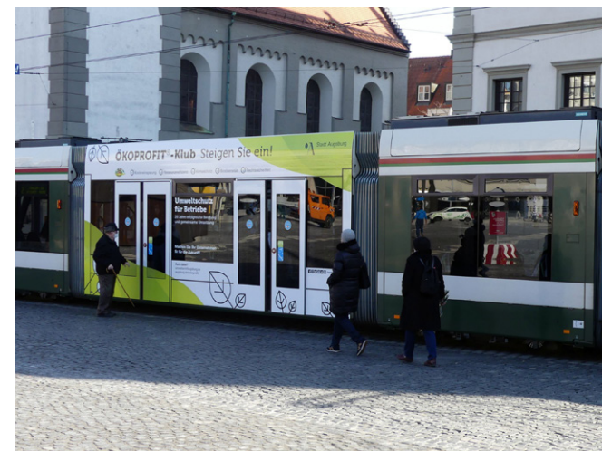
Zum 20-jährigen Jubiläum des ÖKOPROFIT®-Klubs im Jahr 2021 wurde eine Straßenbahn gestaltet.

Im Jahr 2001 startete ÖKOPROFIT® Augsburg mit dem Ziel, Betriebe wirtschaftlich zu stärken und gleichzeitig die Umweltsituation zu verbessern. Seitdem haben bereits 83 Betriebe aus der Region teilgenommen, viele Unternehmen über den ÖKOPROFIT®-Klub sogar mehrfach. Dank des Umweltmanagementsystems konnten in diesen 20 Jahren eine große Menge an Strom, CO 2 , Wärme, Kraftstoff und Kosten eingespart werden.