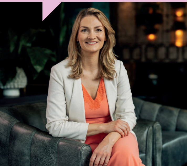
Judith Gerlach, MdL

Bayerische Staatsministerin für Gesundheit, Pflege und Prävention